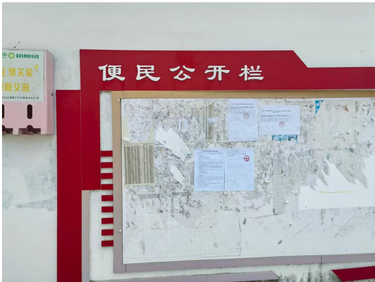
图 6 羊角屯现场张贴公示情况