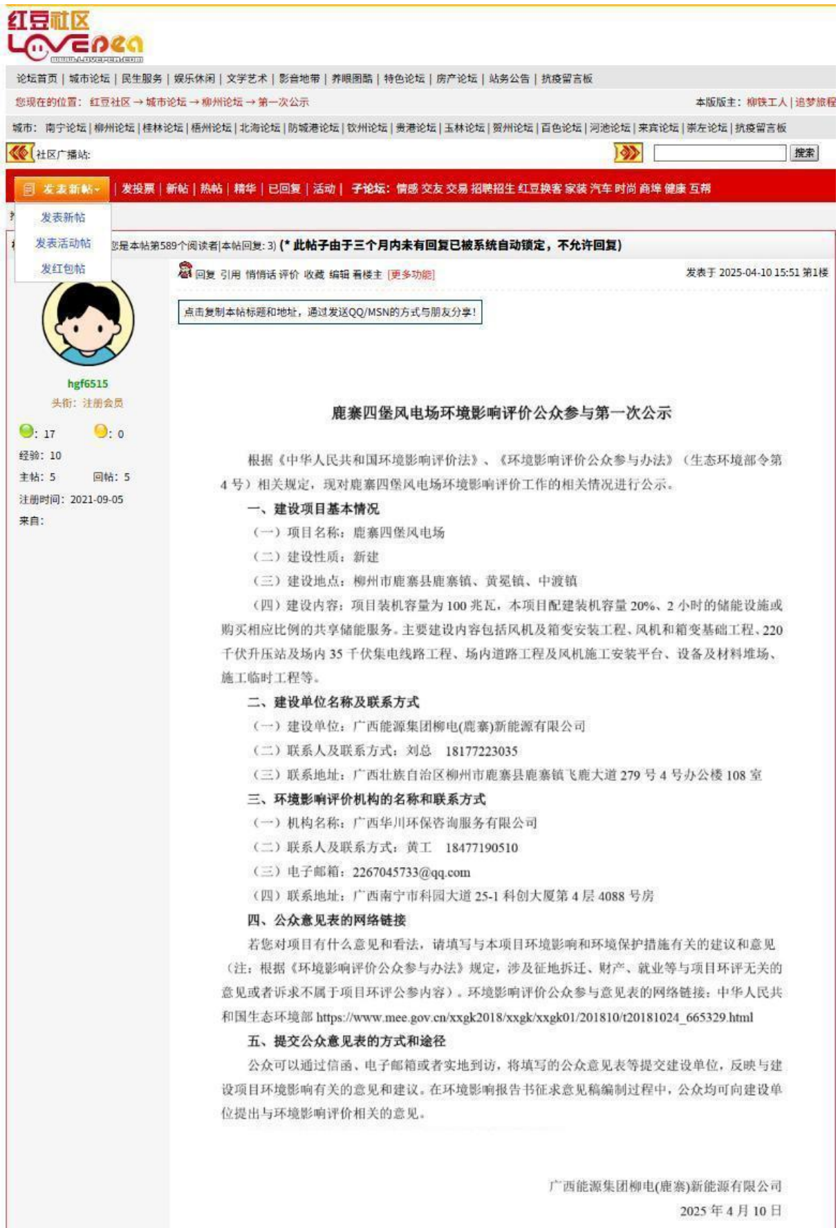
图 2.2-1 第一次公示网络截图