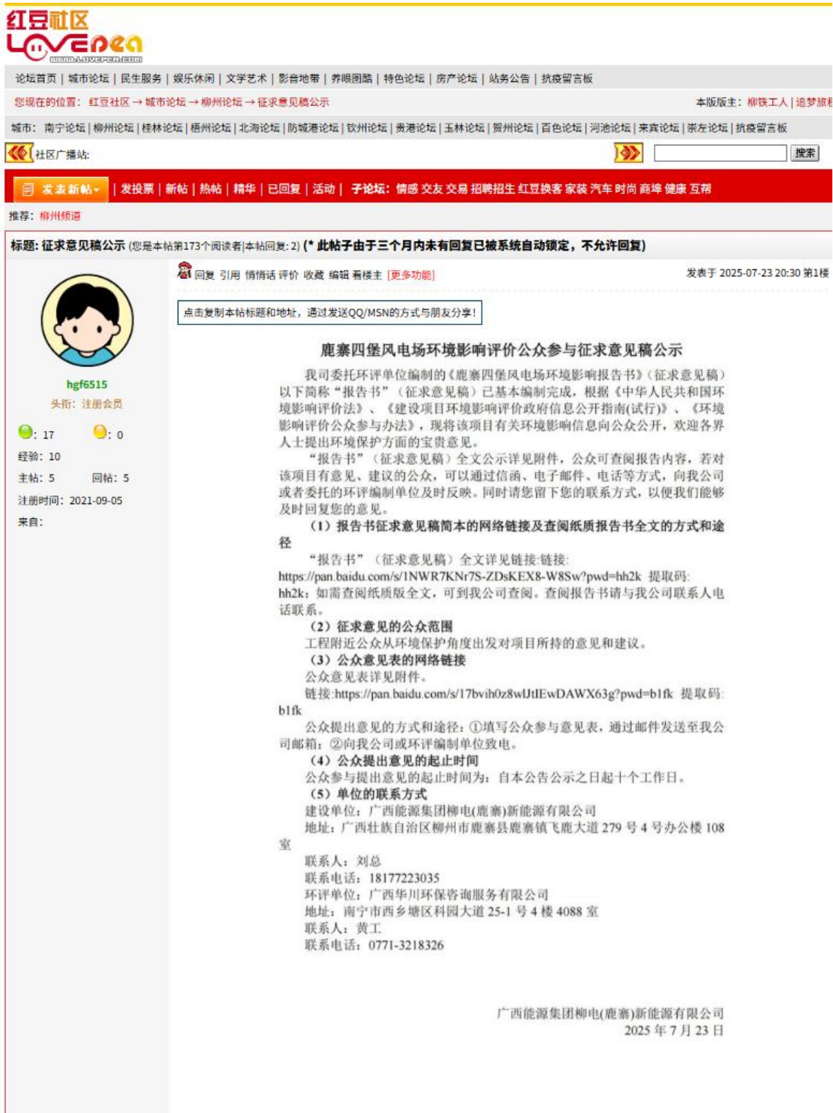
图 3.2-1 第二次公示网络截图