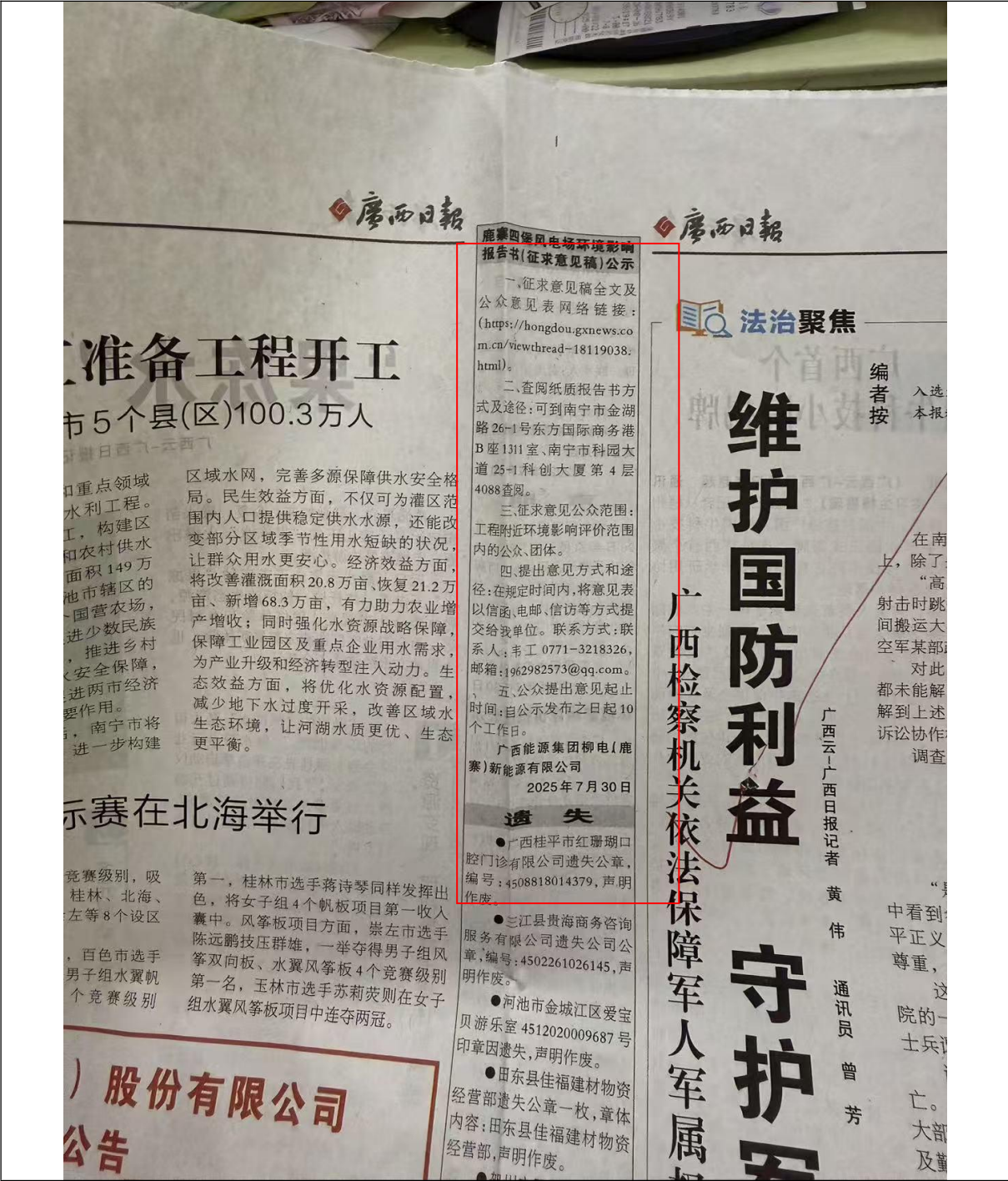
图 3.2-2 第一次报纸公示

本单位于 2025 年 7 月 30 日、7 月 31 日通过广西日报对项目进行了两次公示，公开项目建设概况及项目其他信息获取途径。公示内容见图 3.2-2 及图 3.2-3。