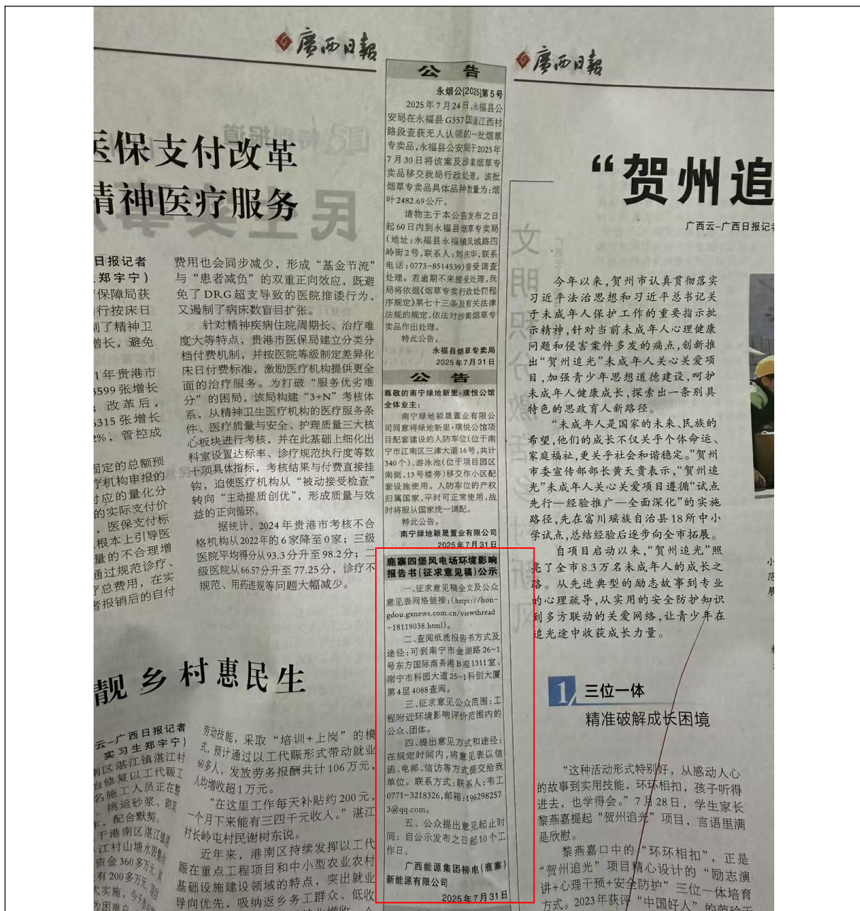
图 3.2-3 第二次报纸公示