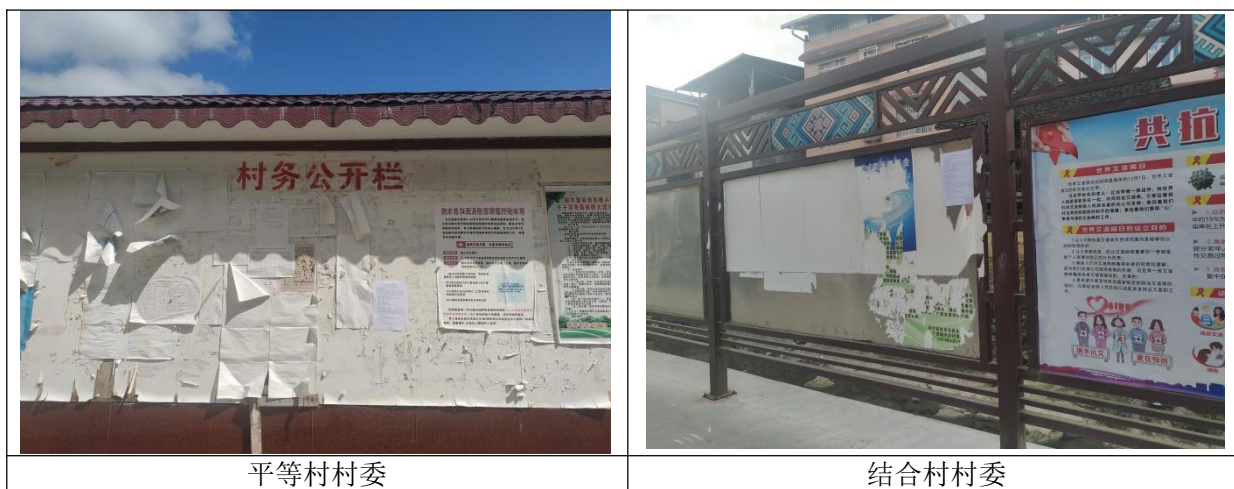
图 3-4 现场公示照片示意

在编制单位基本完成项目环境影响报告书编制工作后，我单位在项目所在区域村屯等公众易于知悉的公告栏上张贴公告公开，张贴区域选取符合《环境影响评价公众参与办法》要求。张贴现场照片见图 3-4。