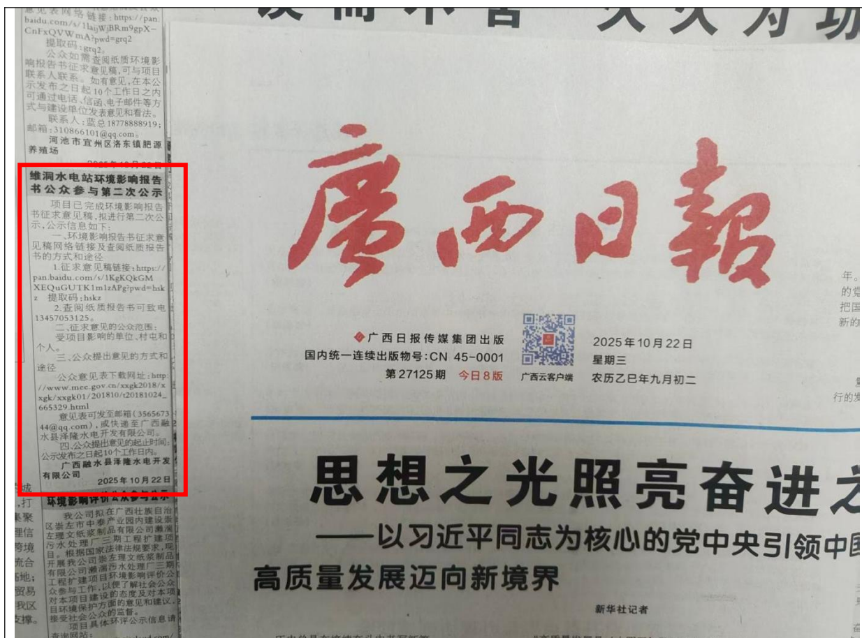
图 3-3 征求意见稿纸媒公示情况照片（2025 年 10 月 22 日）