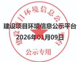
图 3-1 征求意见稿网络公示情况截图