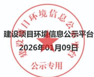
图 2-1 第一次网络公示情况截图