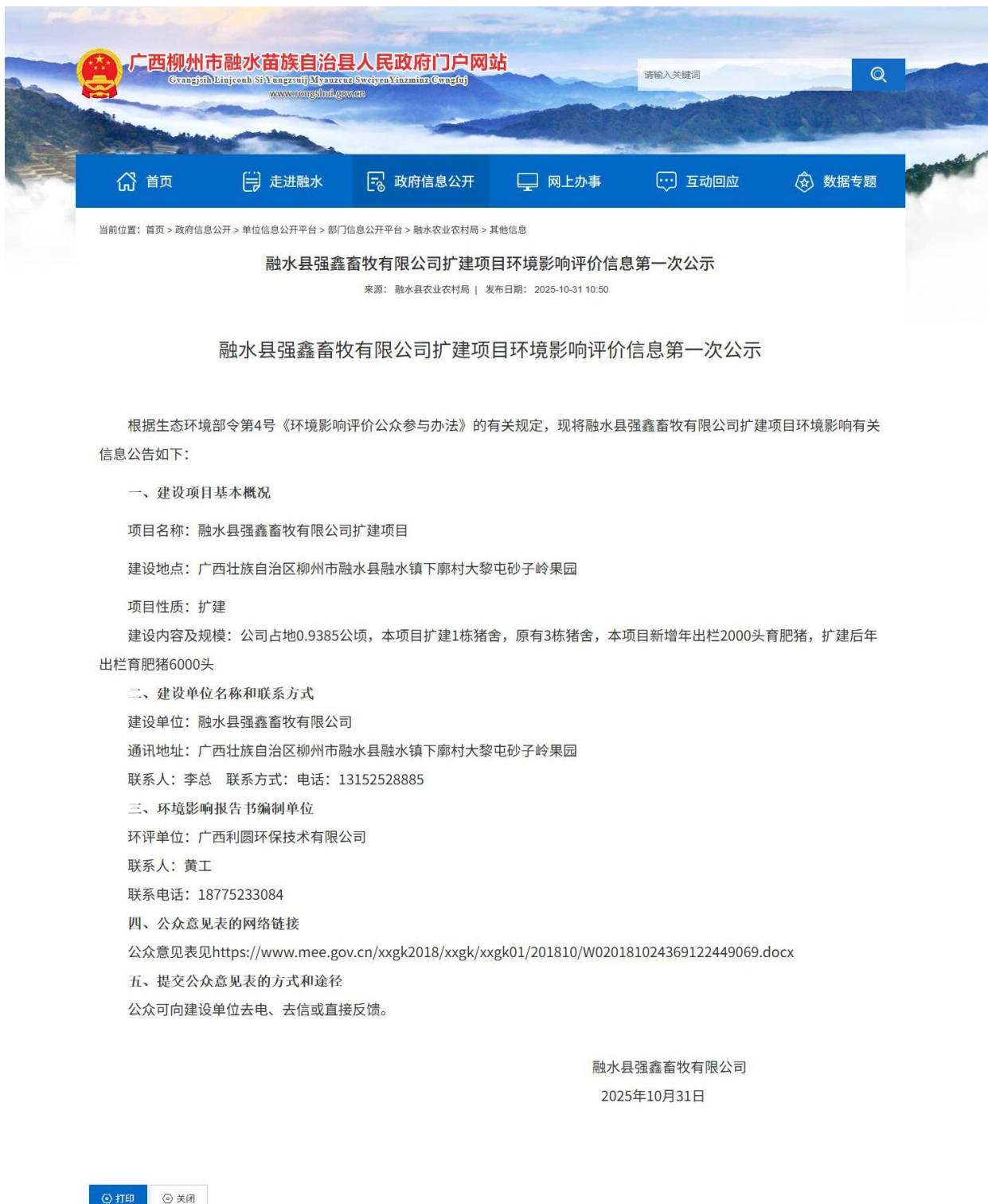
图 1 项目环境影响评价信息第一次公示网上截图