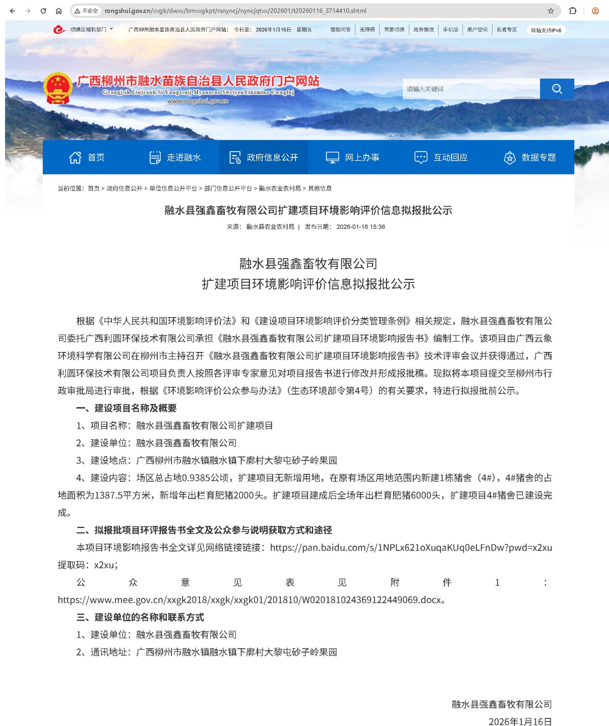
图 7 项目在广西柳州市融水苗族自治县人民政府门户网站拟报批公示网上截图

项目报批前的公开选取广西柳州市融水苗族自治县人民政府门户网站作为公示平台，公示时间为2026年1月16日，公示截图如下：