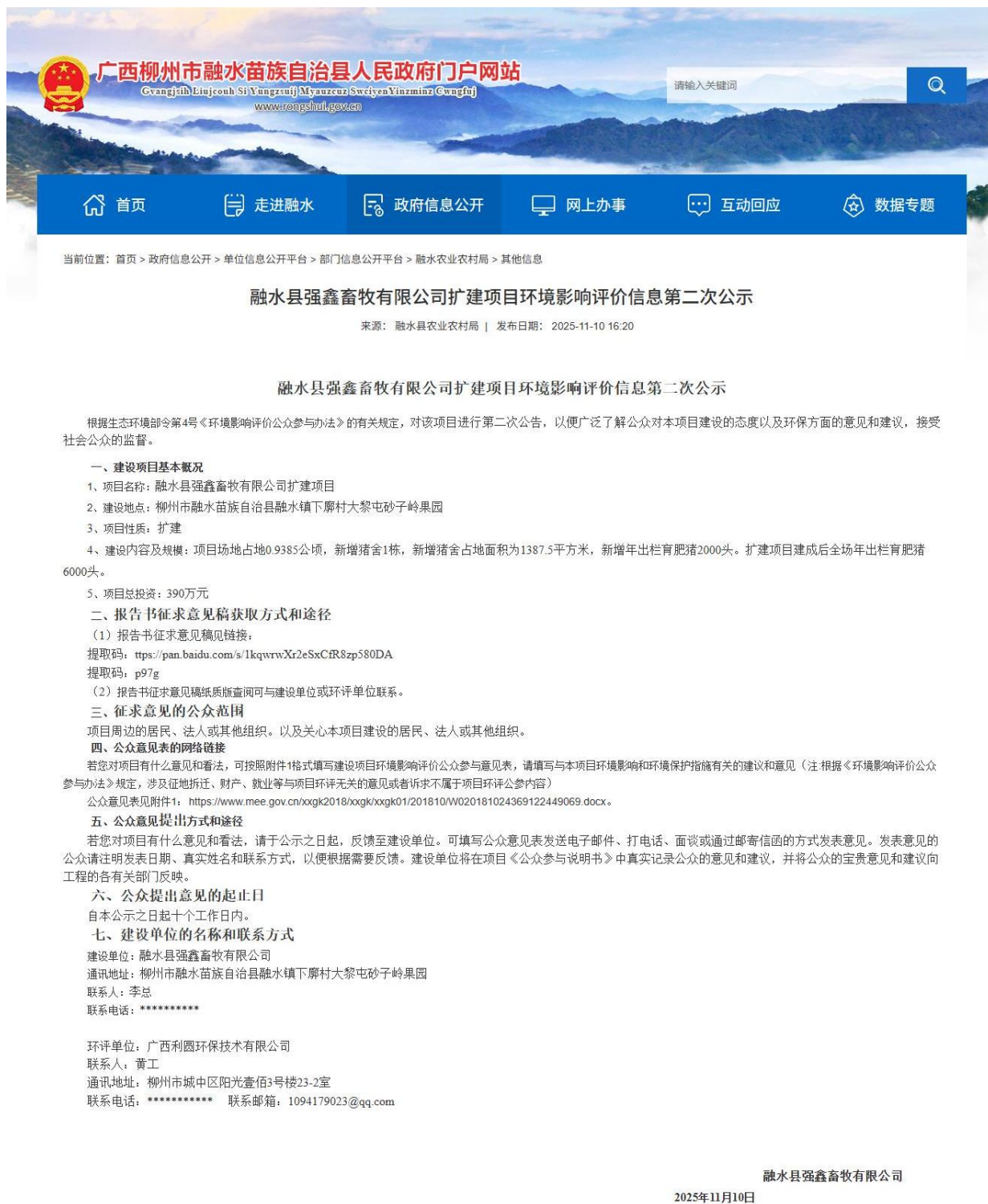
图 2 项目在广西柳州市融水苗族自治县人民政府门户网站第二次公示网上截图