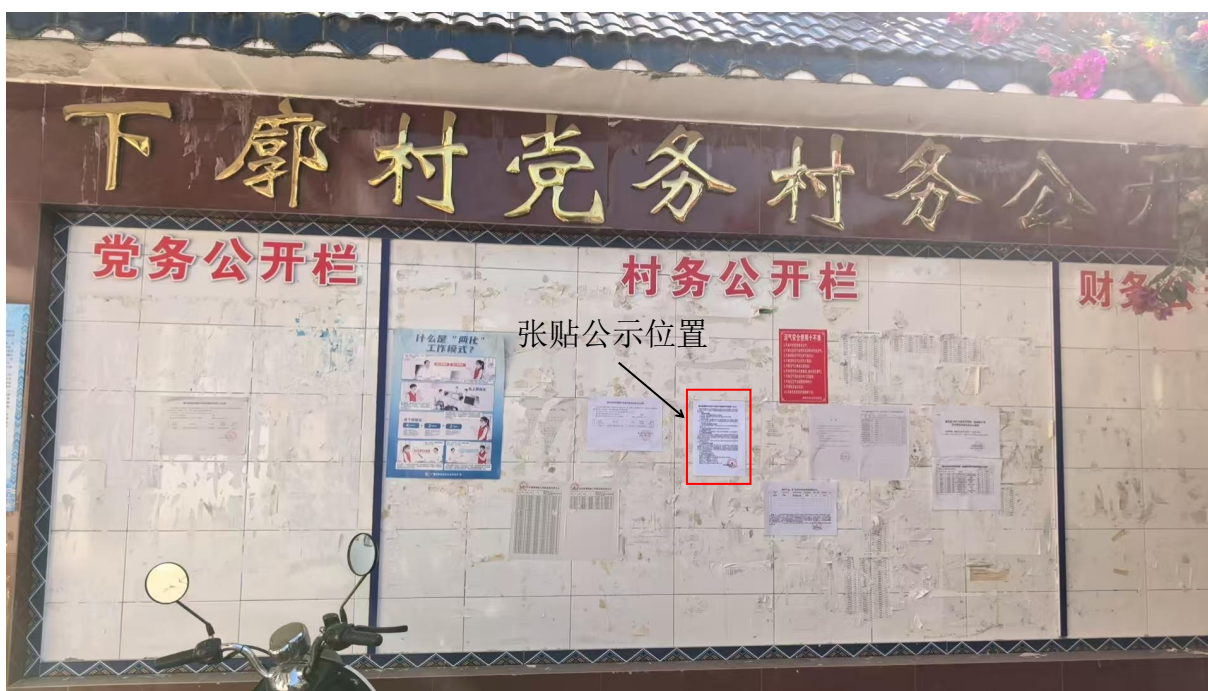
图5 融水镇下廓村党务村务公开栏公示照片