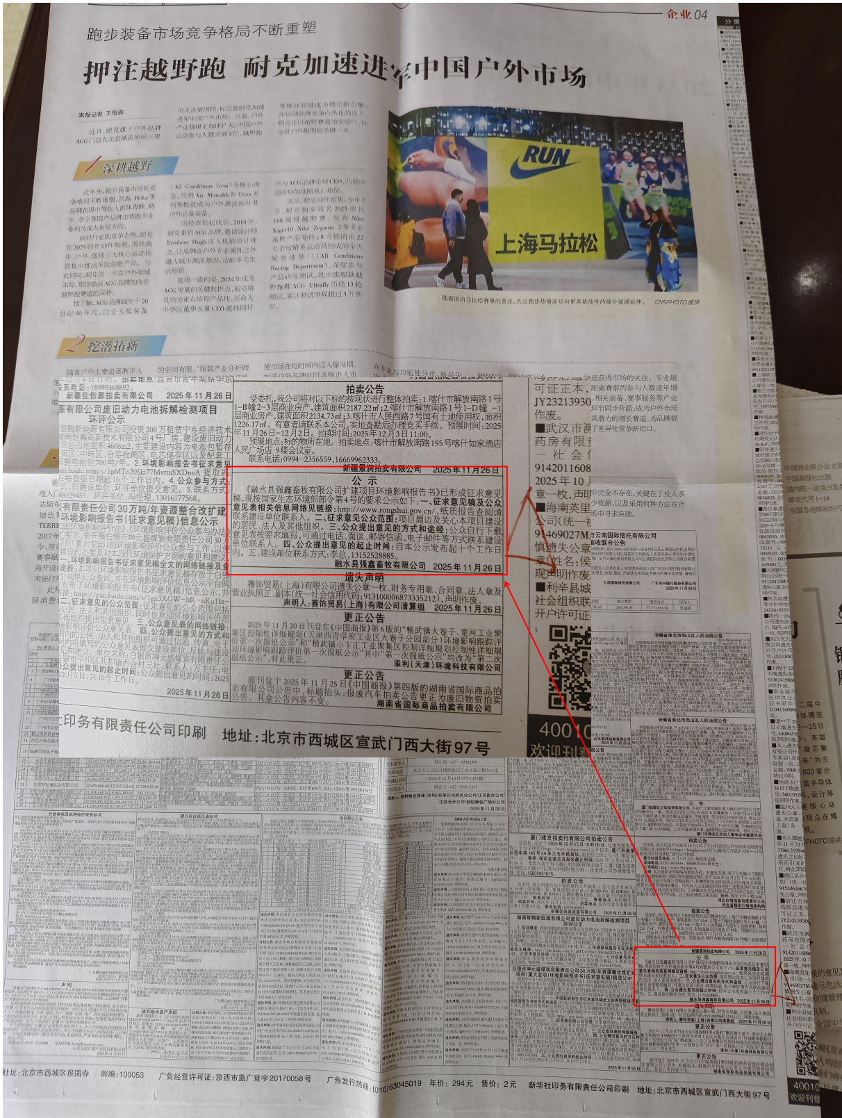
图3 项目在中国商报第一次公示图片（2025年11月26日）