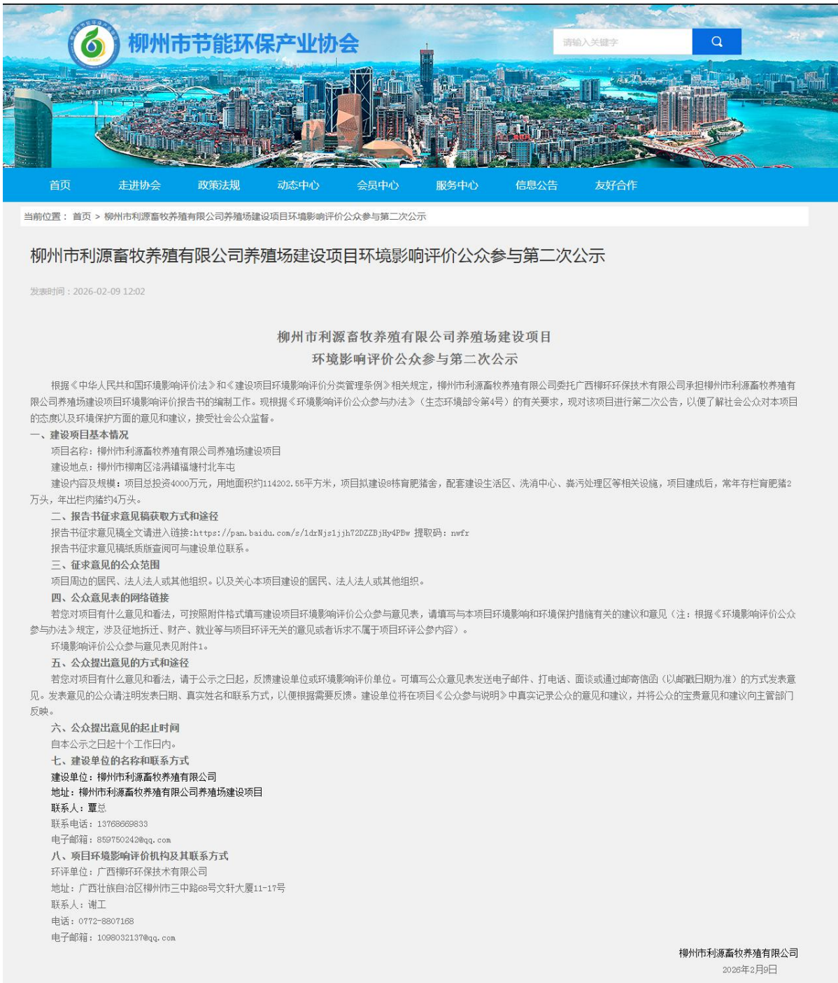
图 2 项目环评公众参与第二次公示网上截图