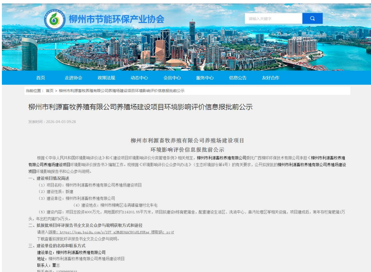
图 6 项目报批前公示截图

按照《环境影响评价公众参与办法》（生态环境部令第4号）的要求，我公司于2026年4月3日在柳州市节能环保产业协会网站上（ https://lzecepxh.jz.fkw.com/nd.jsp?id=655&id=655 ）进行了柳州市利源畜牧养殖有限公司养殖场建设项目环境影响报告书报批前公示。