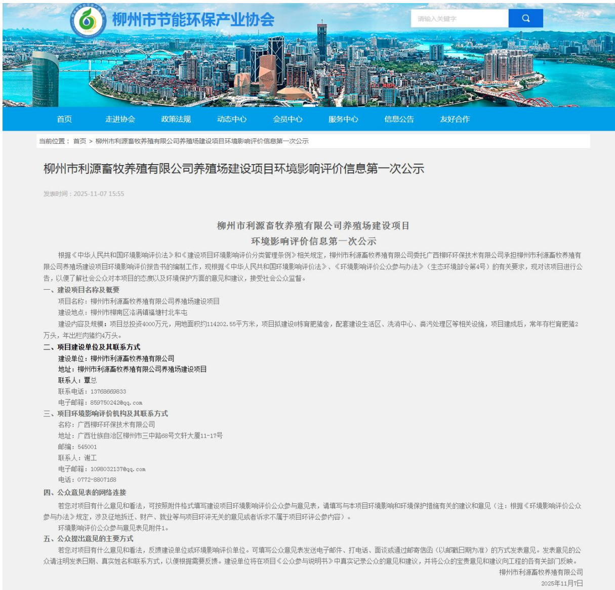
图 1 项目环评公众参与首次公示网上截图