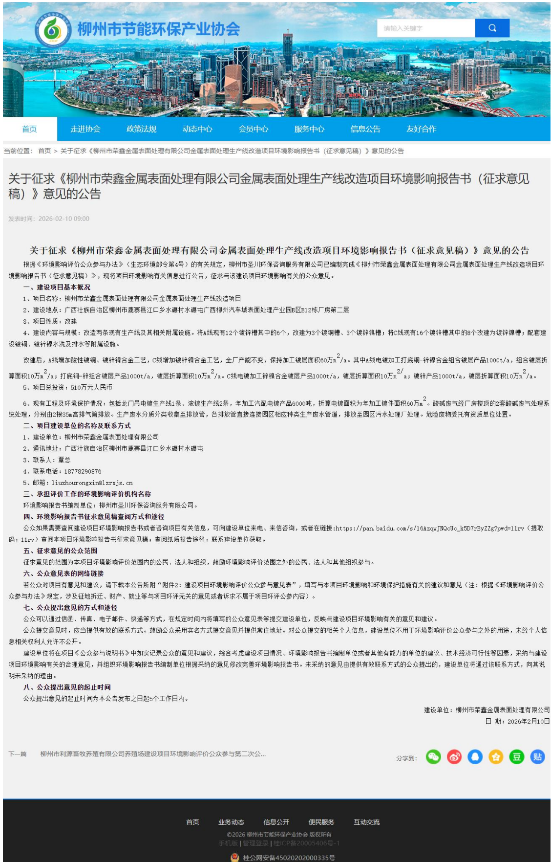
图 3.2-1 征求意见稿公示网页截图