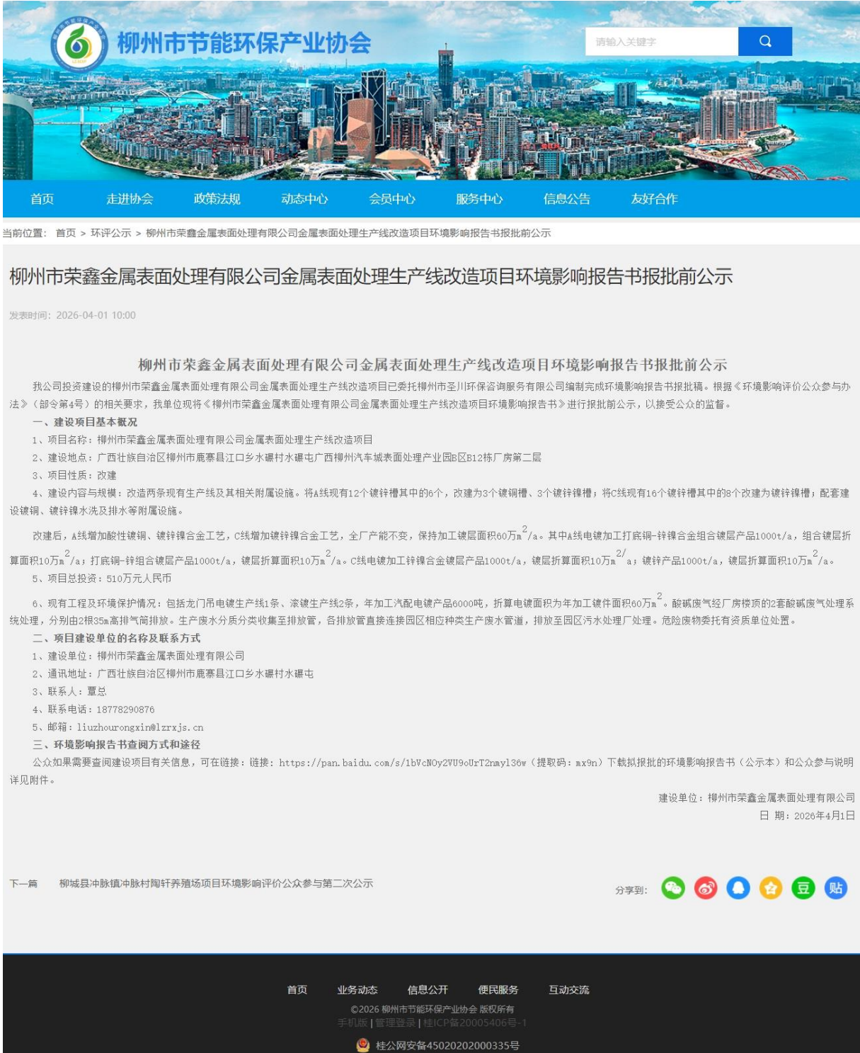
图 6.2-1 报批前公开网页截图