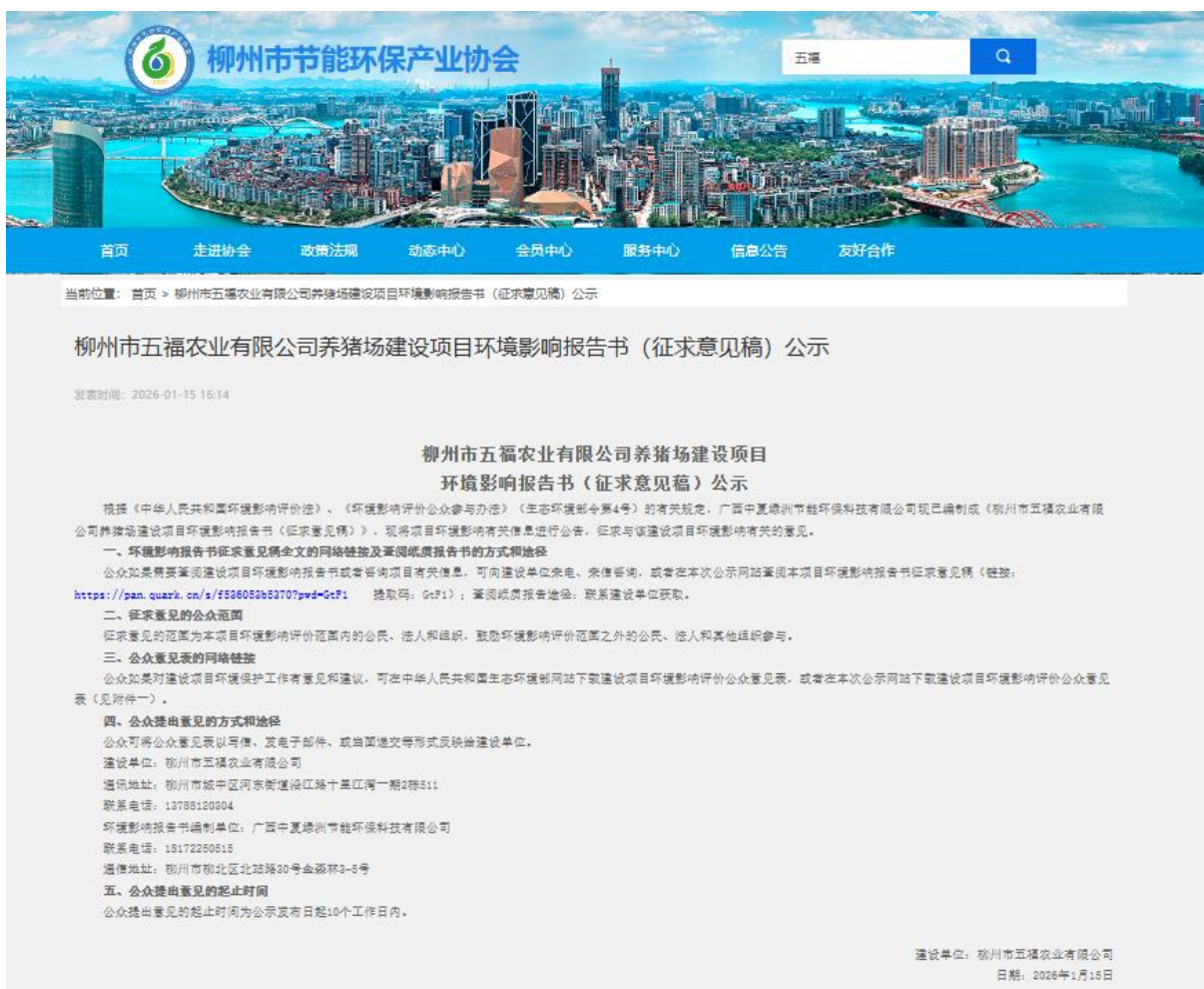
图 3-1 第二次网络公示全页面截图