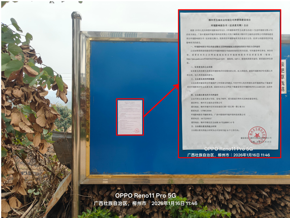
图 3-5 鹿寨镇龙田村公示张贴