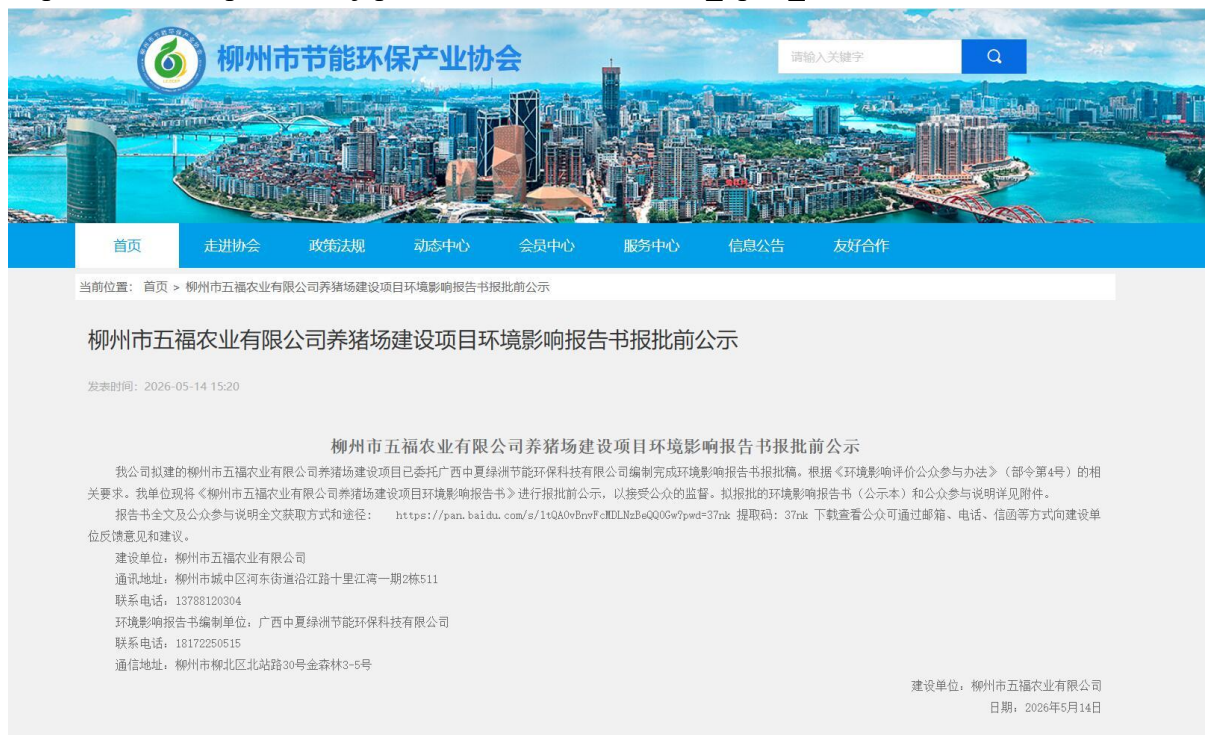
图 4-1 报批前公示截图

http://www.lzecep.com/nd.jsp?fromCollId=2&id=661#_np=2_319 ，公示截图如下：