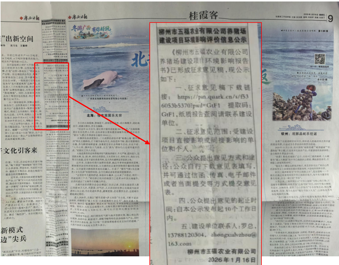
图 3-3 第一次报纸公示（2026年1月16日）