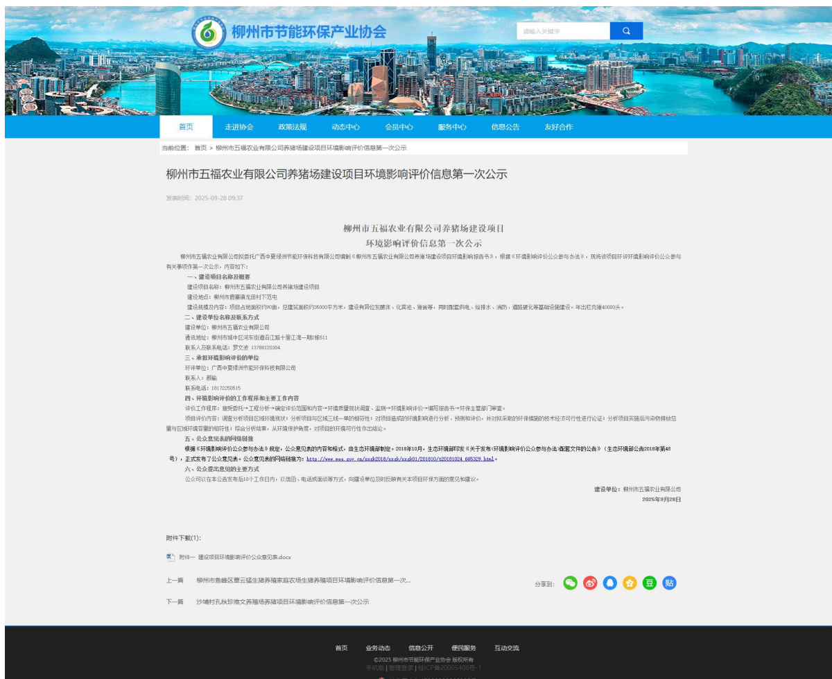
图 2-1 第一次网络公示全页面截图