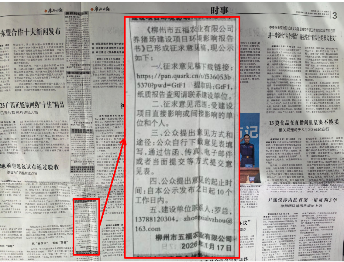
图 3-4 第二次报纸公示（2026年1月17日）