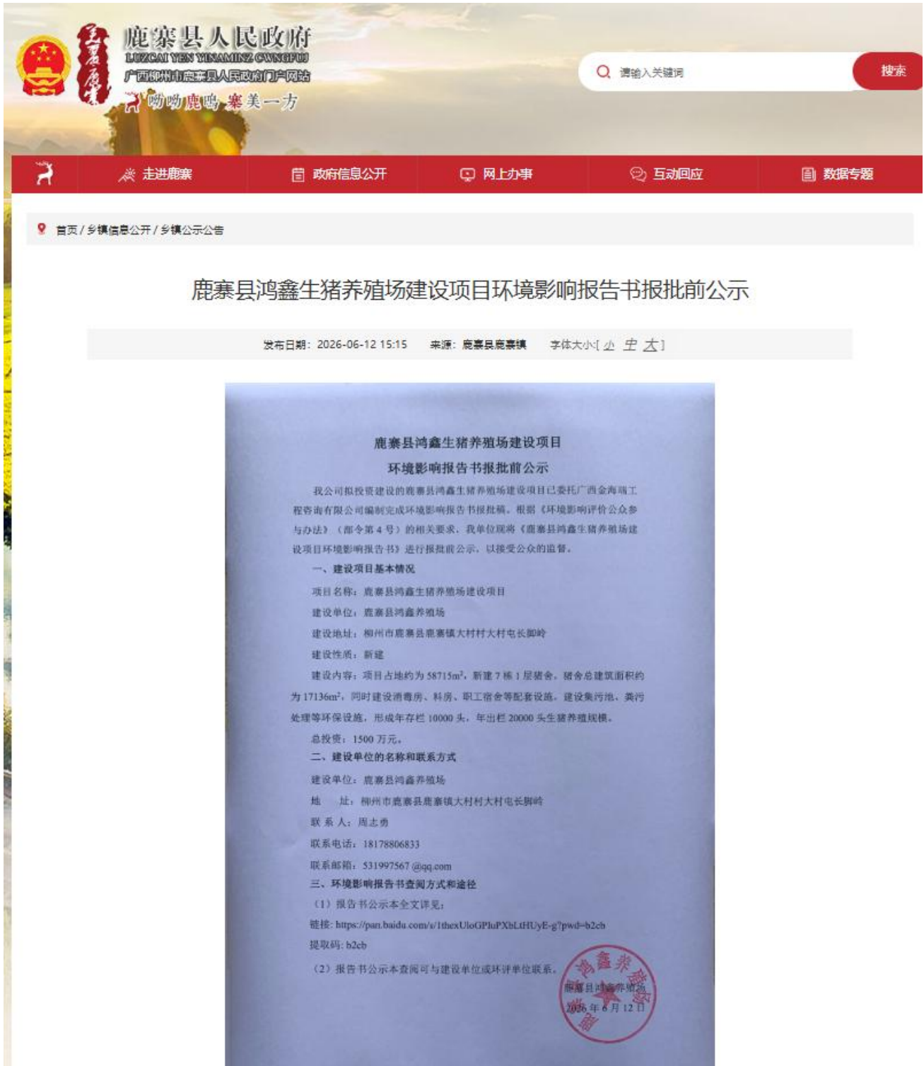
图 6.2-1 报批前公示网页截图