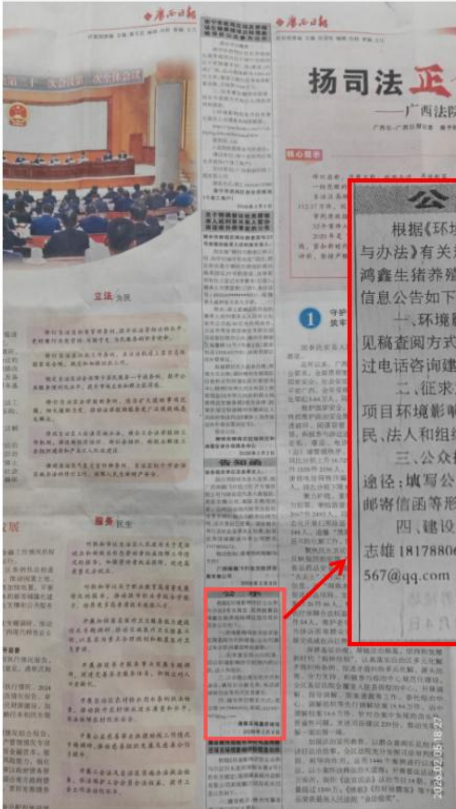
图 3.2-3 第二次报纸公示（2026.2.4）截图