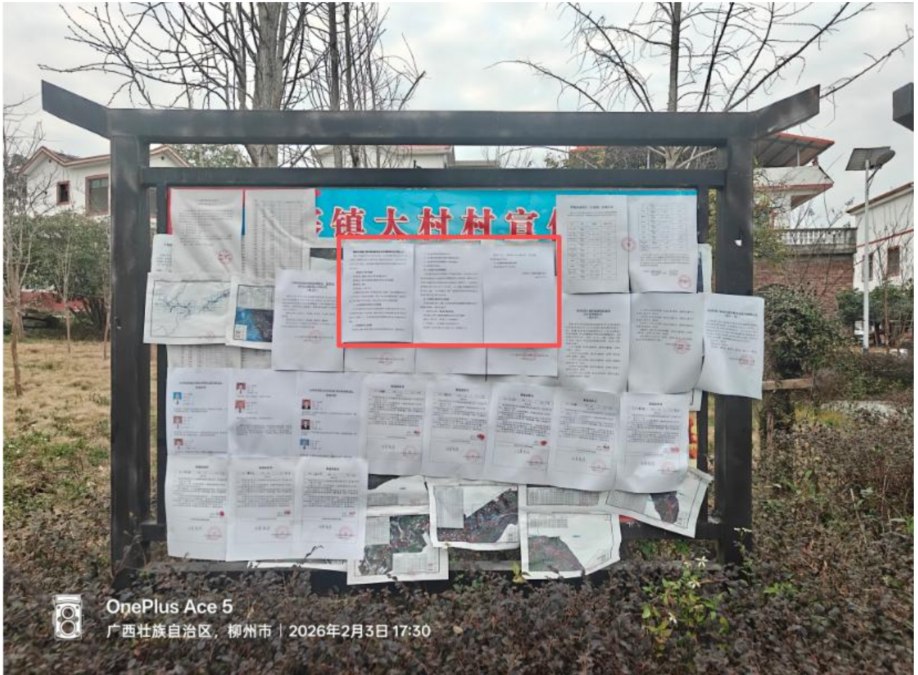
图 3.2-4 征求意见稿张贴公告现场照片