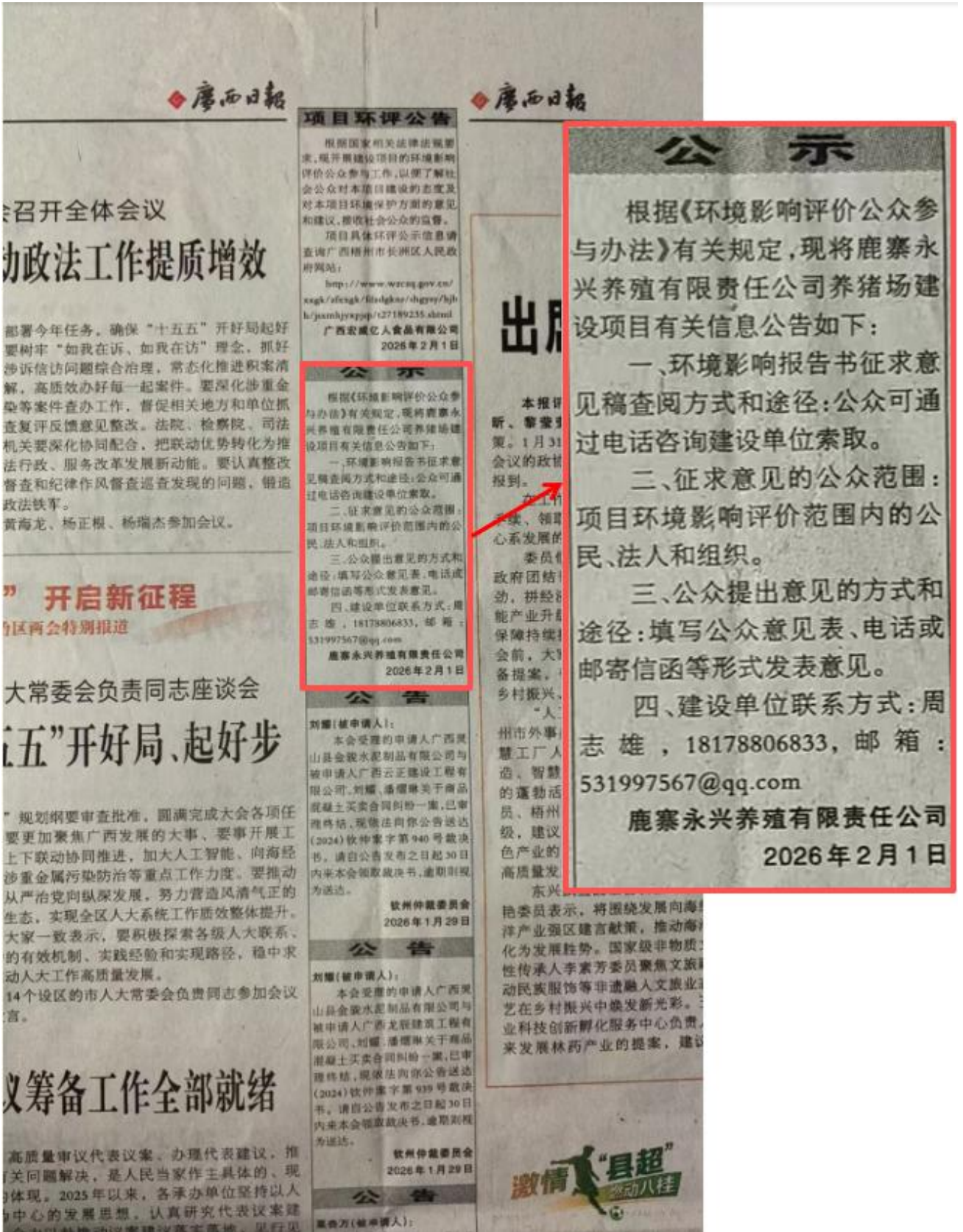
图 3.2-3 第二次报纸公示 (2026.2.1) 截图