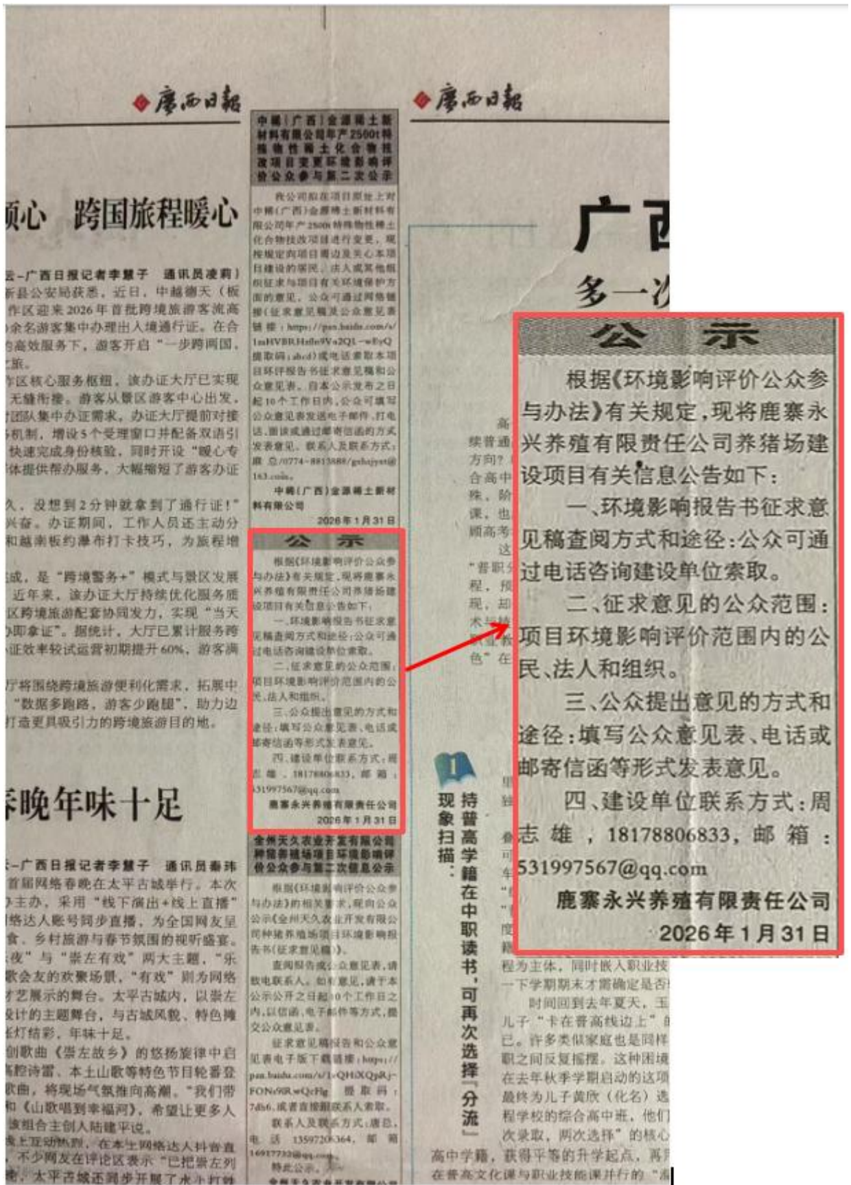
图 3.2-2 第一次报纸公示（2026.1.31）截图