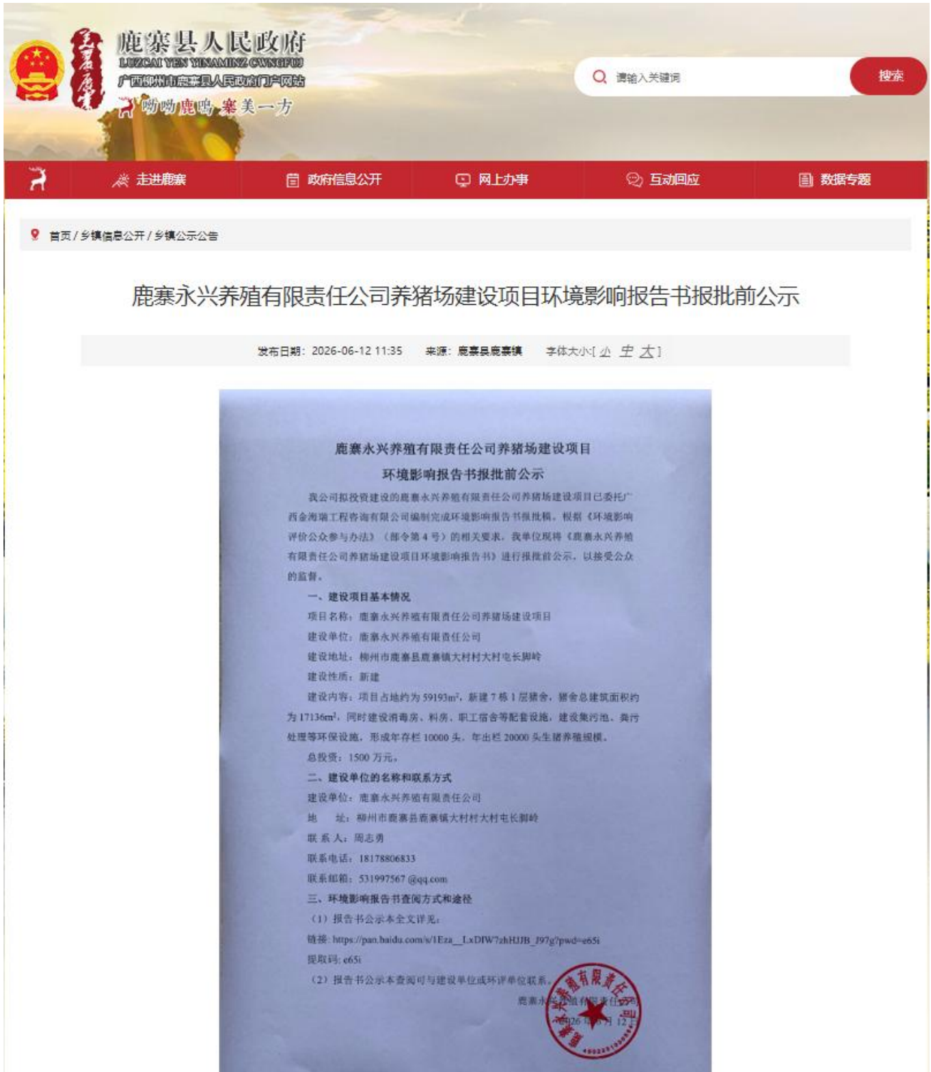
图 6.2-1 报批前公示网页截图