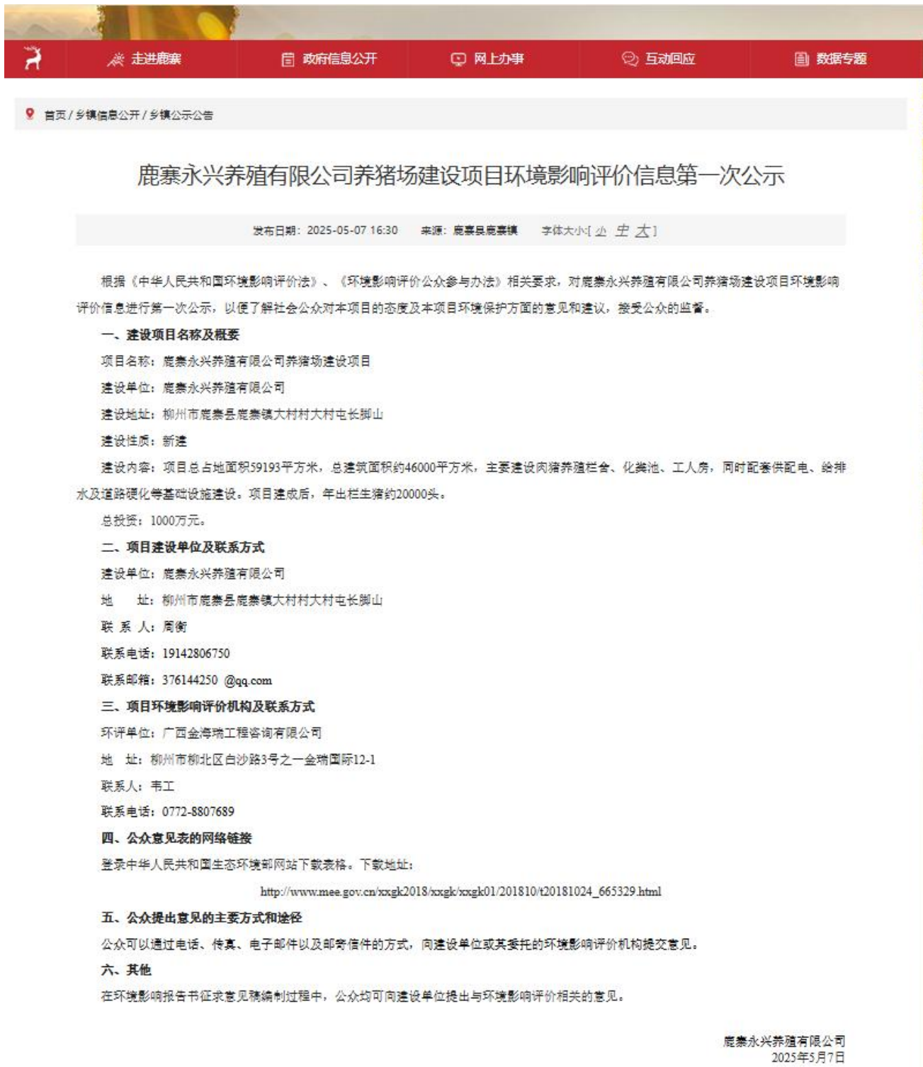
图 2.2-1 首次环境影响评价信息公示网页截图