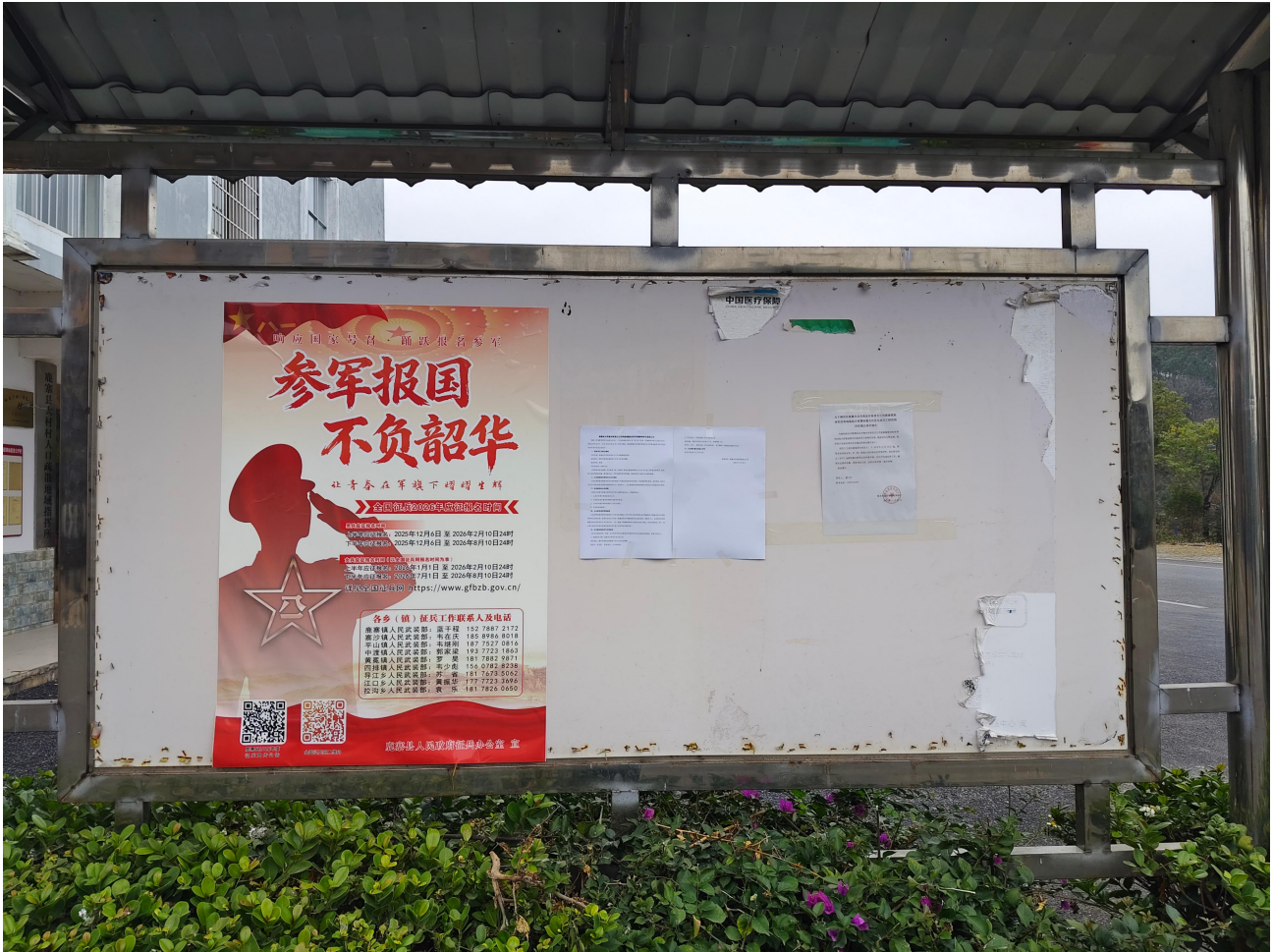
图 3.2-4 征求意见稿张贴公告现场照片