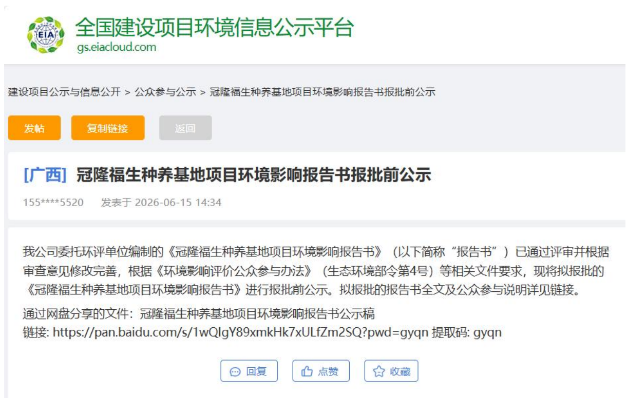
图 6-1 报批前公示截图

( https://www.eiacloud.com/gs/userCenter ) 进行了报批前公示。