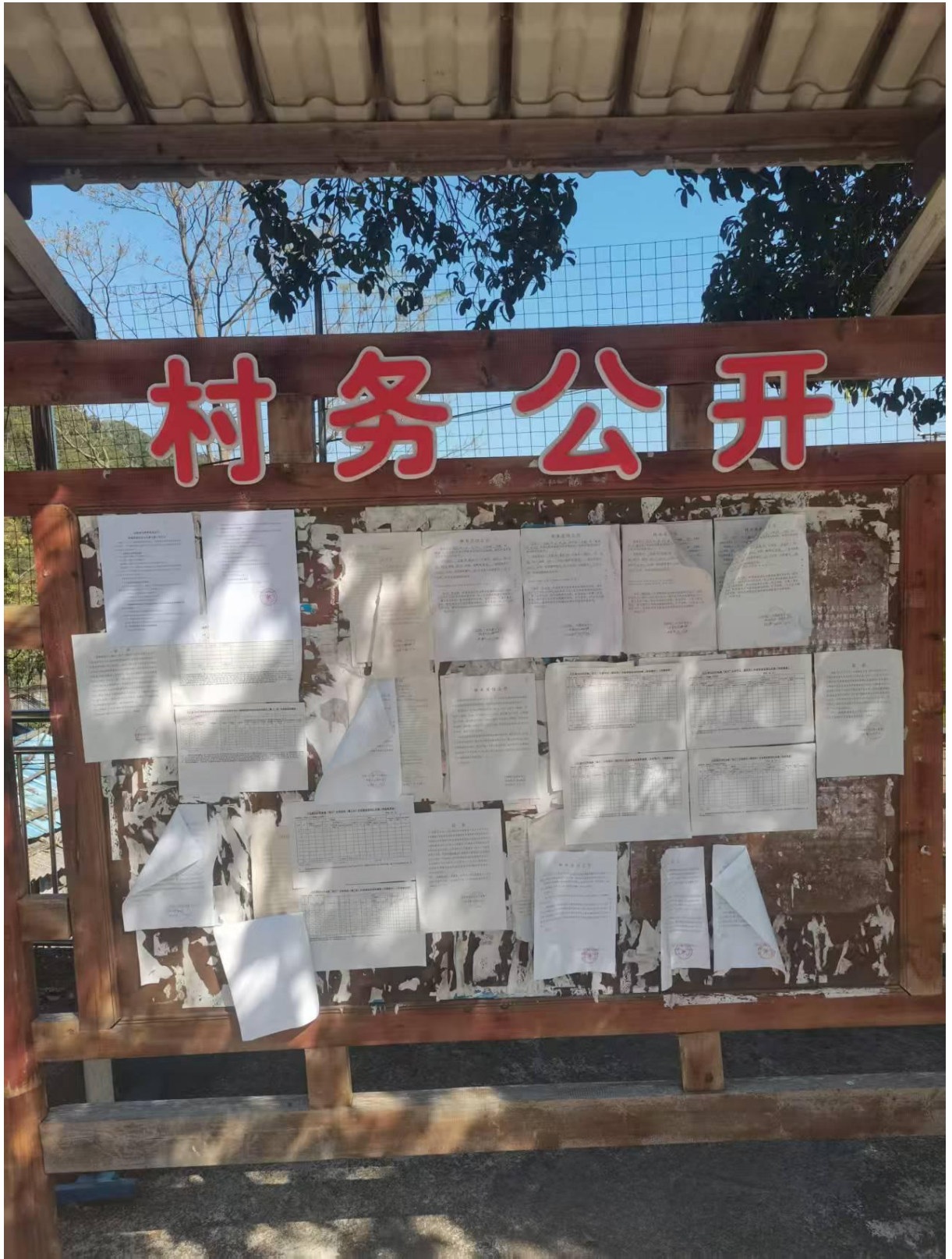
图 3-4 合桐村公开栏公示截图