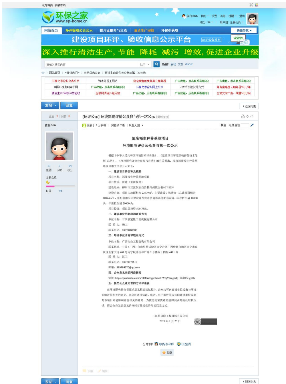
图 2-1 项目环境影响评价信息第一次公示网上截图