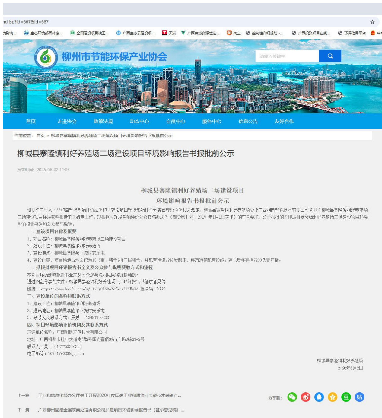
图 2 项目在广西柳州市节能环保产业协会官网拟报批公示网上截图