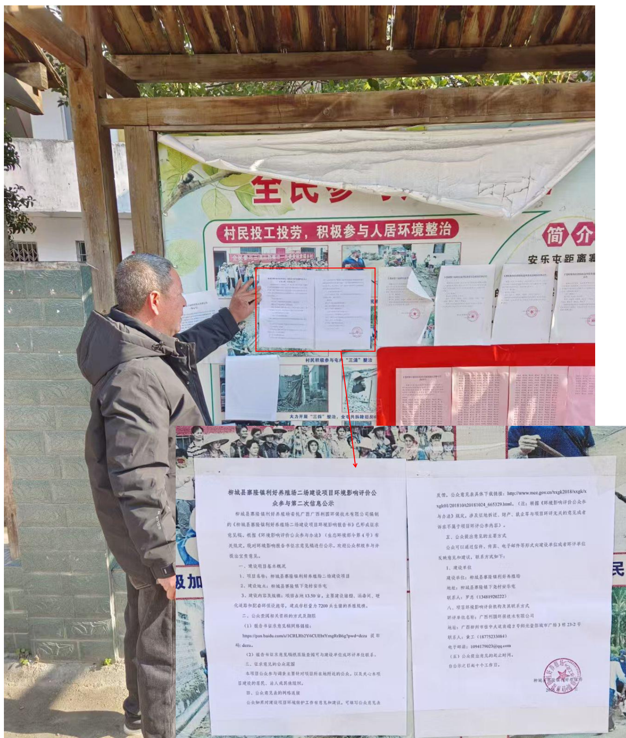
图5 安乐屯二次公示张贴