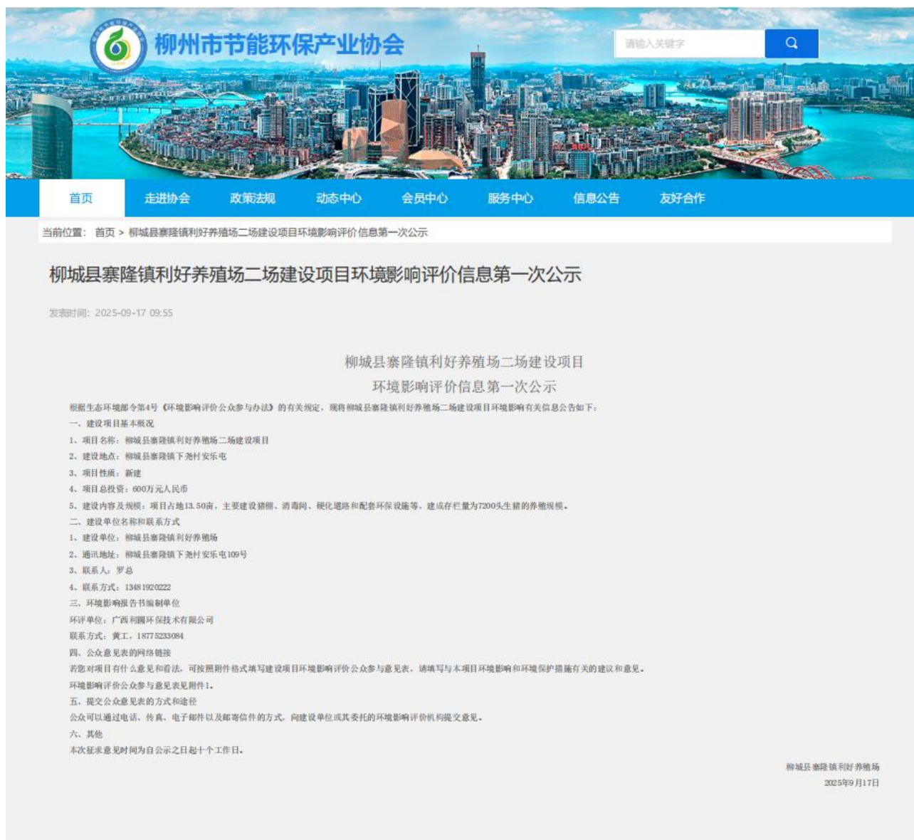
图1 项目环境影响评价信息第一次公示网上截图