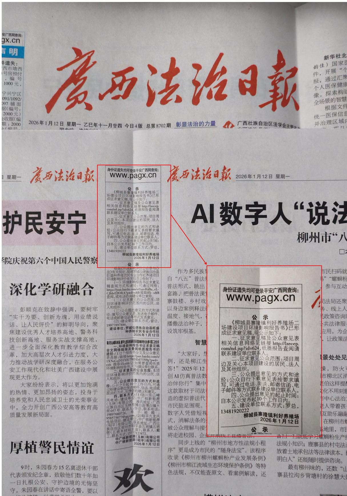
图 4 项目在广西法治日报第二次公示图片（2026 年 1 月 12 日）