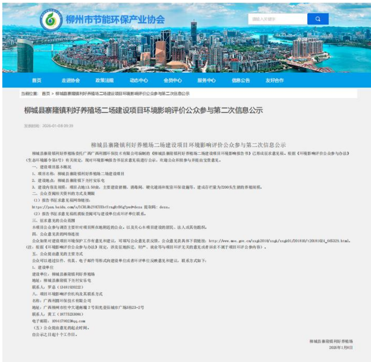
图 2 项目第二次公示网上截图