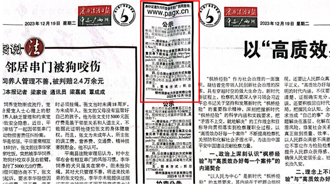
图3-3 征求意见稿纸媒公示情况照片