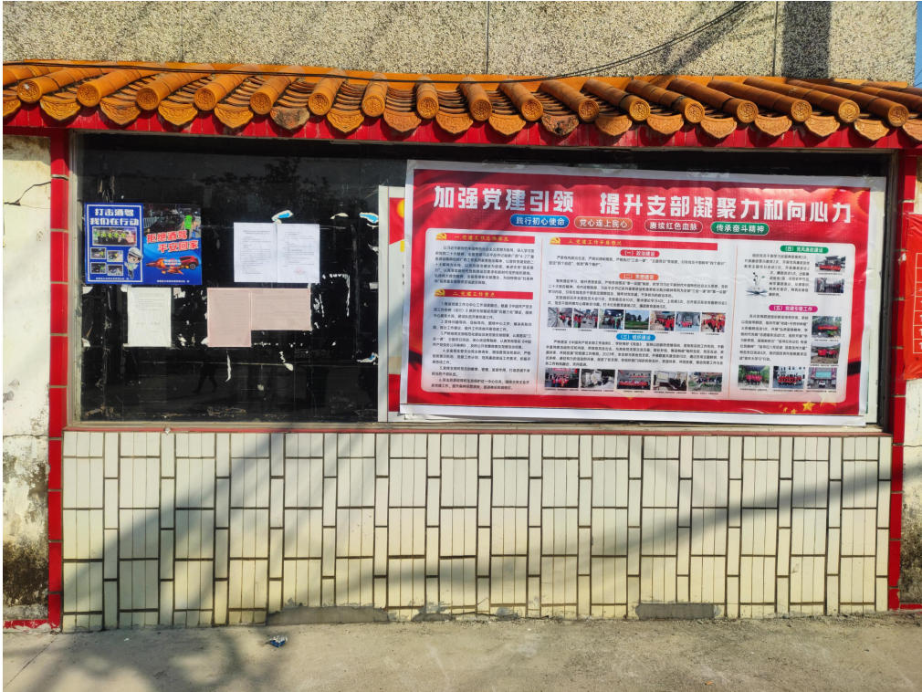
图 3-6 征求意见稿项目周边公示情况照片