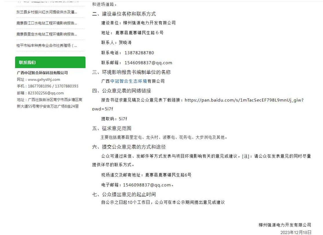
图3-2 征求意见稿网络公示情况截图