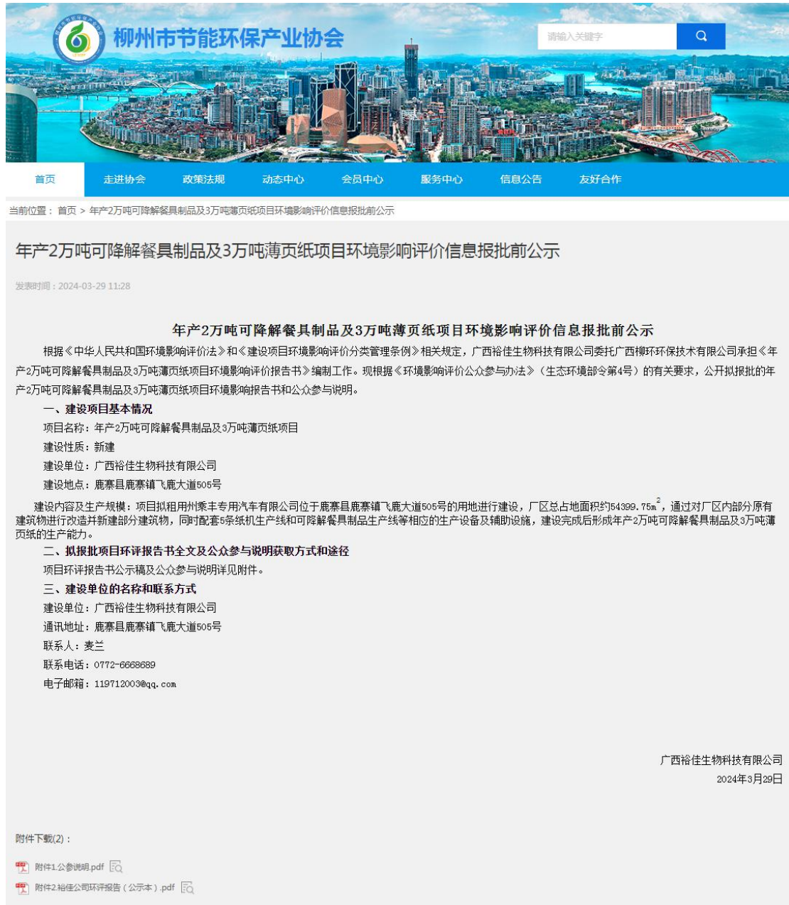
图 4 项目报批前公示网上截图