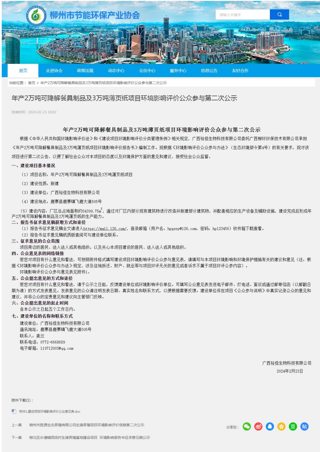
图 1 项目第二次公示网上截图