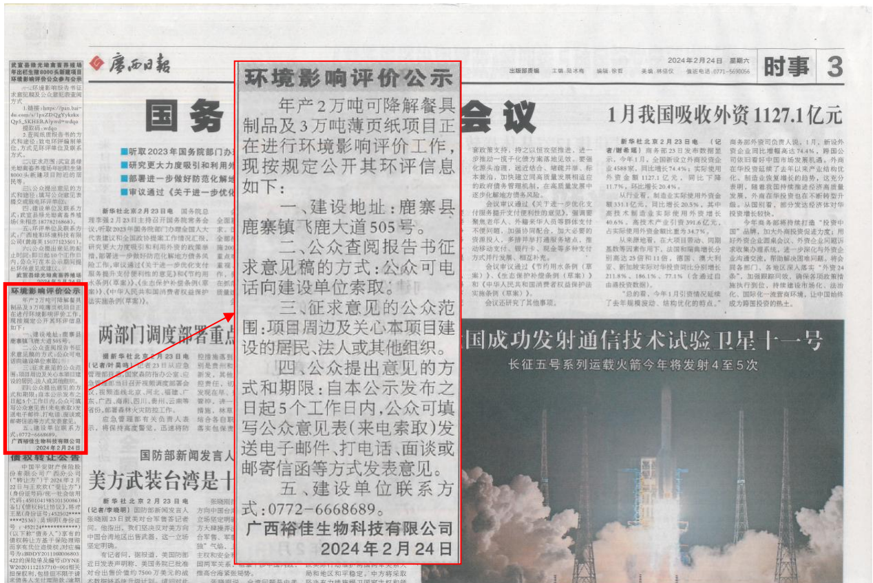
图2 广西日报登报公示图片（2024年2月24日刊登）

本项目环境影响评价公众参与信息公告于2024年2月24、25日在广西日报刊登2次。相关报纸照片如下：