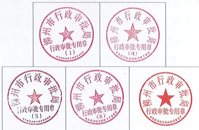
(继续保留使用印章印模)

二、继续保留使用 1 号、4 号、5 号、6 号和无编号的审批专用章。继续保留使用印章的具体样式如下：